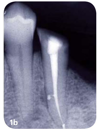
1. Cas de difficulté moyenne. Prémolaire mandibulaire nécrosée chez un patient âgé en bon état de santé général.