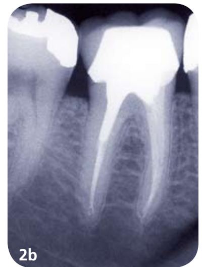
2. Cas de difficulté modérée. Pulpite irréversible aiguë chez un patient en parfait état de santé. La présence d'un délabrement coronaire a nécessité la reconstitution de la paroi distale pour permettre la pose d'un champ opératoire étanche. Malgré la présence d'un pulpolithe dans la chambre, les canaux sont visibles et la courbure des racines est modérée.